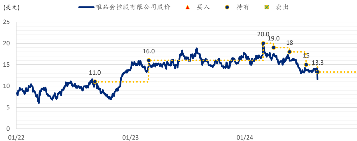
图表 2：浦银国际目标价：唯品会（VIPS.US）