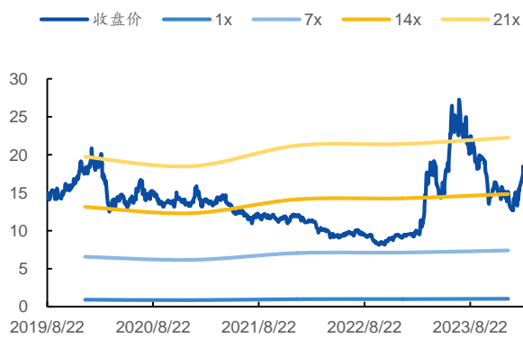
图 1：P/E Band