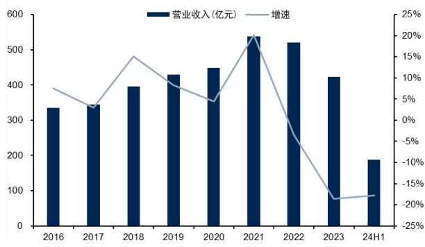
图1：公司营业收入及增速（单位：亿元、%）

公司发布中报：上半年实现营收 187.75 亿元，同比-17.77%；实现归母净利润 8.00 亿元，同比+16.35%；实现扣非归母净利润 9.98 亿元，同比+67.95%。公司 24Q1/Q2 分别实现营收 83.99/103.76 亿元，Q2 环比+23.53%；24Q1/Q2 分别实现归母净利润 3.26/4.74 亿元，Q2 环比+45.16%；24Q1/Q2 分别实现扣非归母净利润 3.04/6.94 亿元，Q2 环比+128.51%。公司 Q2 扣非归母净利润表现亮眼，主要得益于 Q2 锡价环比有比较明显提升，沪锡 24Q1/Q2 均价分别为 21.72/26.40 万元/吨，Q2 环比+21.54%，公司充分享受锡价上涨带来的业绩弹性。