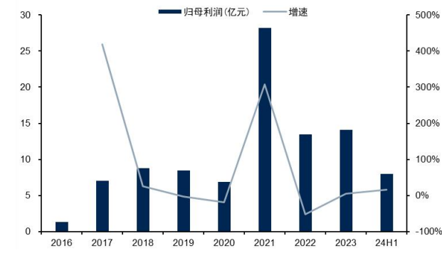
图2：公司归母净利润（单位：亿元）