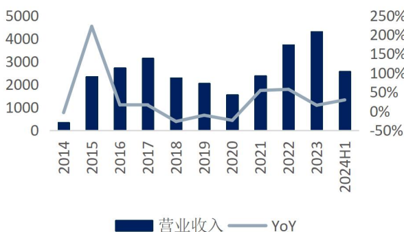
图1: 恺英网络营业收入及增速 (单位: 百万元、%)

业绩稳步增长。 1) 公司 24 上半年实现营业收入 25.55 亿元、归母净利润 8.09 亿元，同比分别增长 29.28%、11.72%，对应全面摊薄 EPS 0.38 元；实现扣非归母净利润 8.0 亿元，同比增长 18.55%；2) 其中 Q2 单季度实现营业收入 12.48 亿元、归母净利润 3.83 亿元，同比分别增长 22.1%、-11.9%，对应摊薄 EPS 0.18 元；3) 公司公布中期分红方案，计划向全体股东每 10 股派发现金红利 1 元（含税），不送红股、不以公积金转增股本。