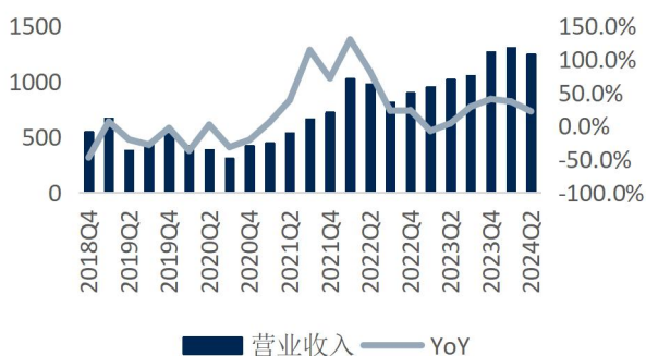
图3: 恺英网络单季度营收及增速 (单位: 百万元、%)