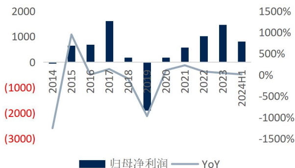
图2: 恺英网络归母净利润及增速 (单位: 百万元、%)