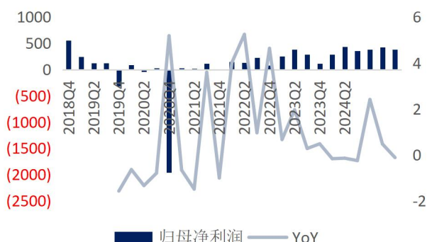
图4: 恺英网络单季归母净利润及增速 (单位: 百万元、%)