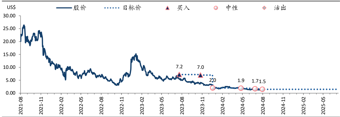
图表 3: 达达集团 (DADA US) 目标价及评级