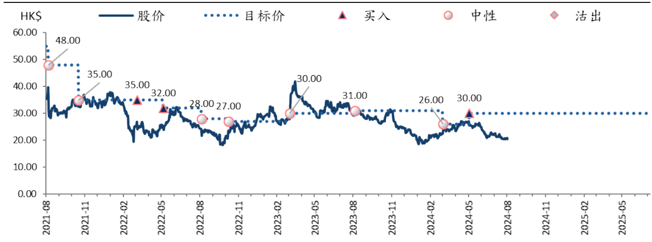
图表 2: 金山软件 (3888 HK) 目标价及评级