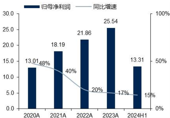
图3: 公司归母净利润及增速（单位：亿元、%）