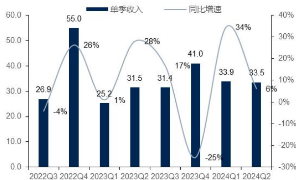
图2: 公司单季营业收入及增速（单位：亿元、%）