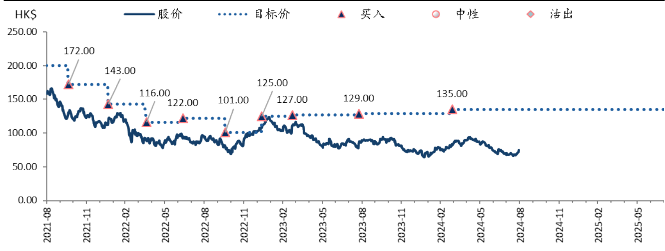
图表 1: 安踏 (2020 HK) 目标价和评级