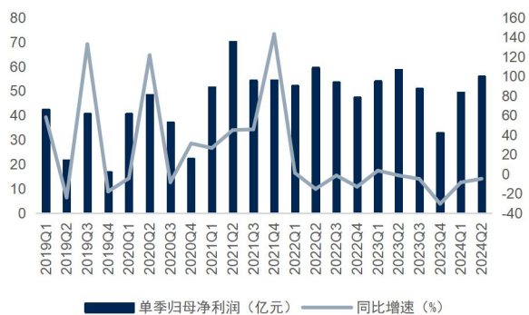
图4：公司单季归母净利润及增速