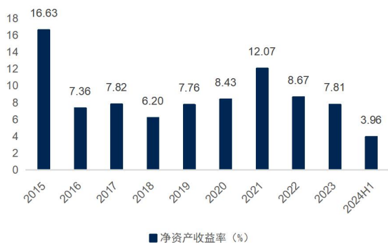
图3：公司净资产收益率