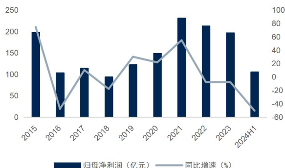
图2：公司归母净利润及增速