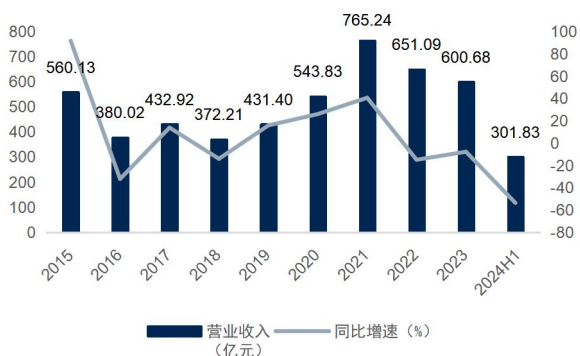
图1：公司营业收入及增速