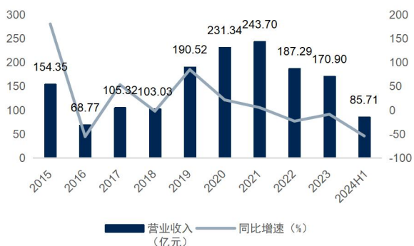
图1：公司营业收入及增速