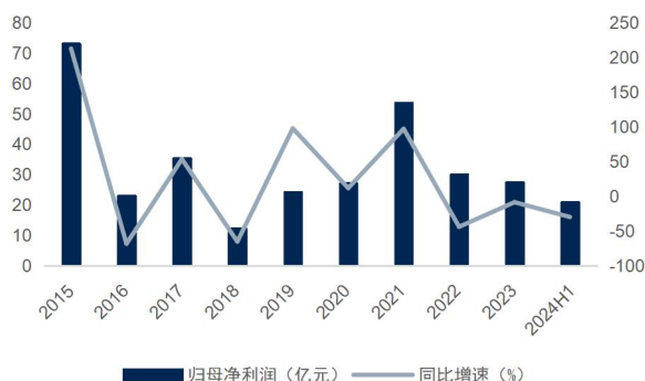
图2：公司归母净利润及增速