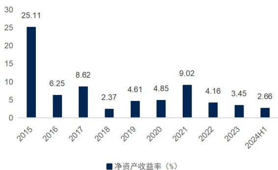
图3：公司净资产收益率