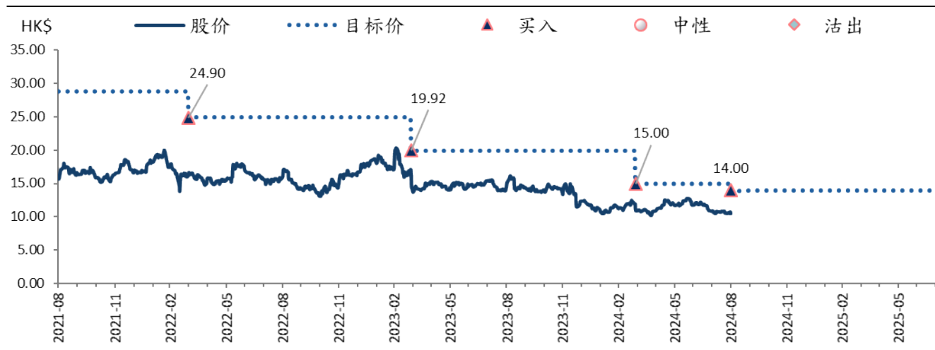
图表 2: 网龙网络 (777 HK) 目标价及评级