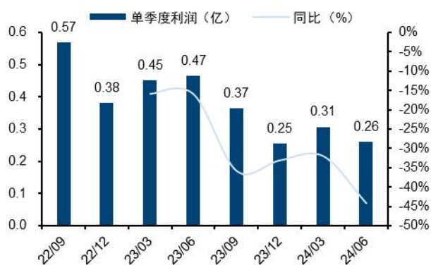
图4：百普赛斯单季归母净利润及增速（单位：亿元、%）