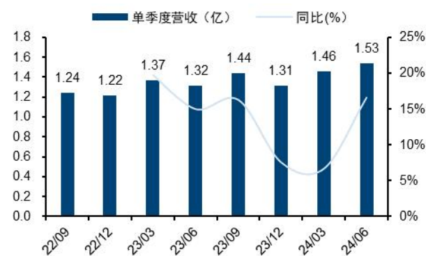
图2：百普赛斯单季营业收入及增速（单位：亿元、%）