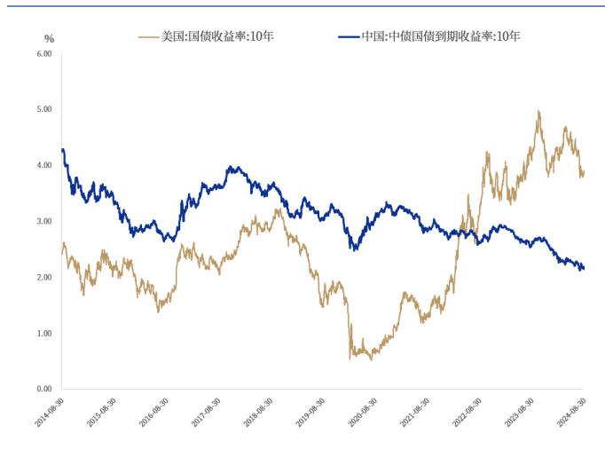
图1: 国债收益率 (10年期)

8月30日，美国10年期国债利率上涨至3.91%，累计上升10bps；8月30日，美元兑人民币中间价报7.11；较8月23日价累计调升234个基点。