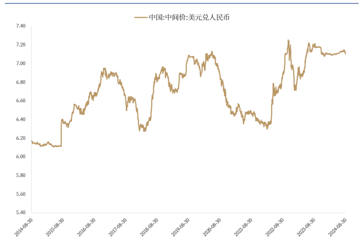
图2: 美元兑人民币汇率 (中间价)