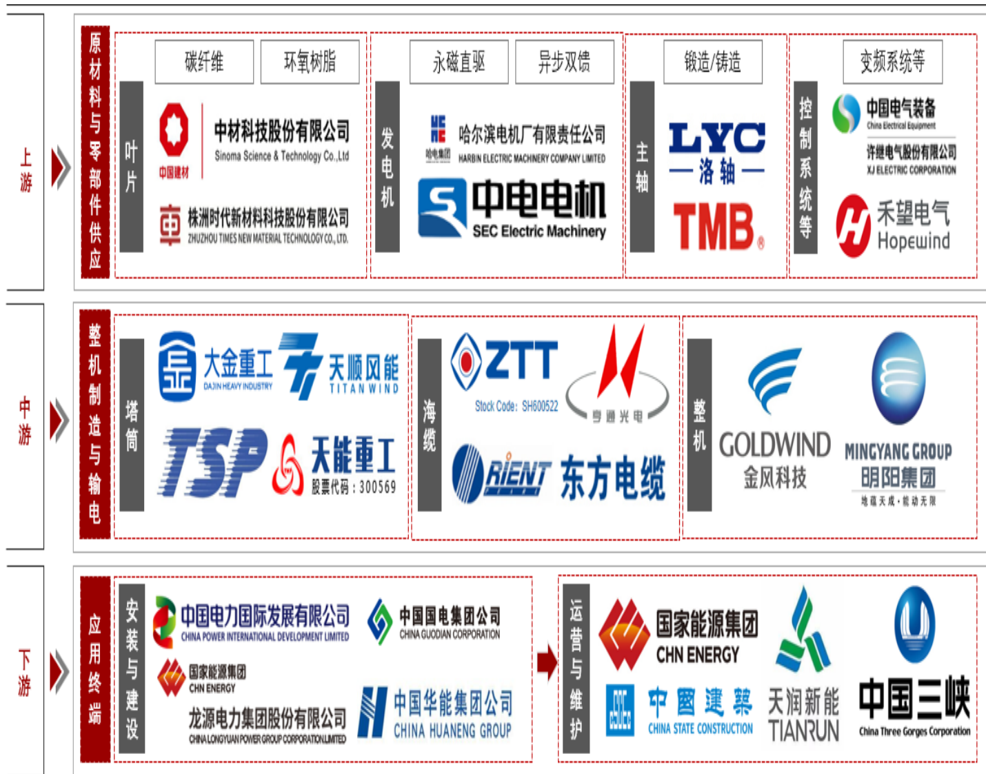
海上风电设备设备产业链图谱

海上风电产业链包括上游的原材料供应（碳纤维、环氧树脂等）；零部件/设备制造（叶片等）、中游的设备制造（塔筒、海缆，整机设计等）和下游的应用终端，包括EPC总成等