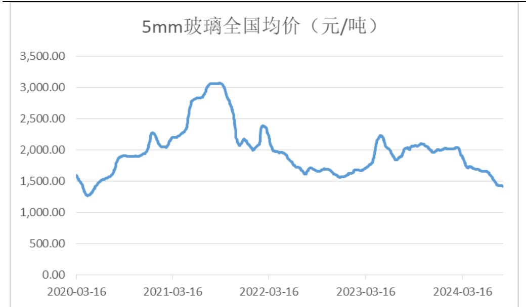
图 2：5mm 玻璃全国均价走势