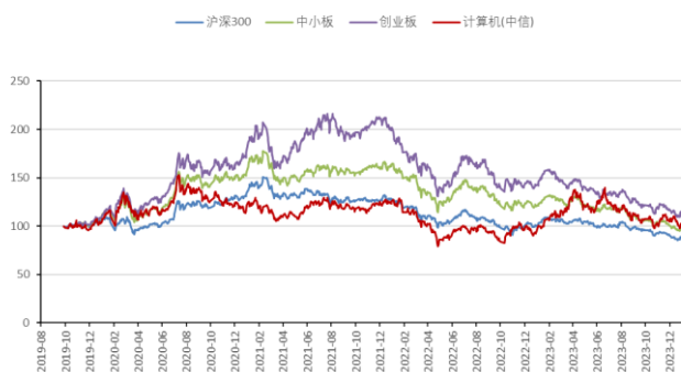
图3：计算机板块指数历史走势