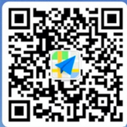
高德交通大数据公众号