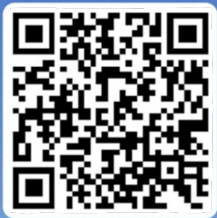
扫码下载高德地图APP