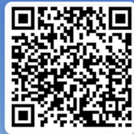
高德交通报告官网