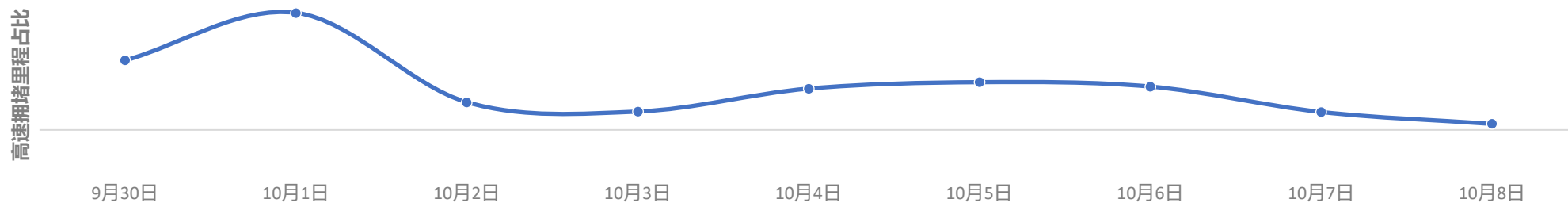
2024年国庆假期期间全国高速公路拥堵趋势预测（小时级）