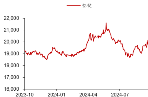
图 3：国内铝锭市场价格（元/吨）