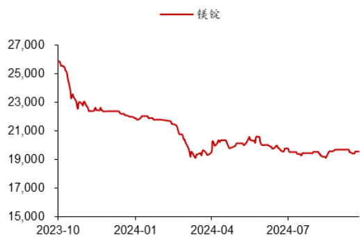
图 4：国内镁锭市场价格（元/吨）