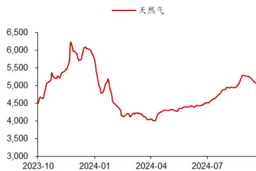
图 5：国内天然气市场价格（元/吨）