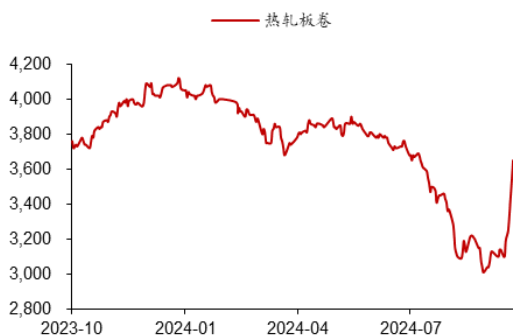
图 2：国内热轧市场价格（元/吨）

据 Wind 数据，截至 2024 年 9 月 30 日，国内热轧、铝锭、镁锭、天然气价格分别为 3650、20190、19530、5058 元/吨，较 2024 年 9 月 24 日分别变化 14.42%、2.8%、0.72%、-0.43%。