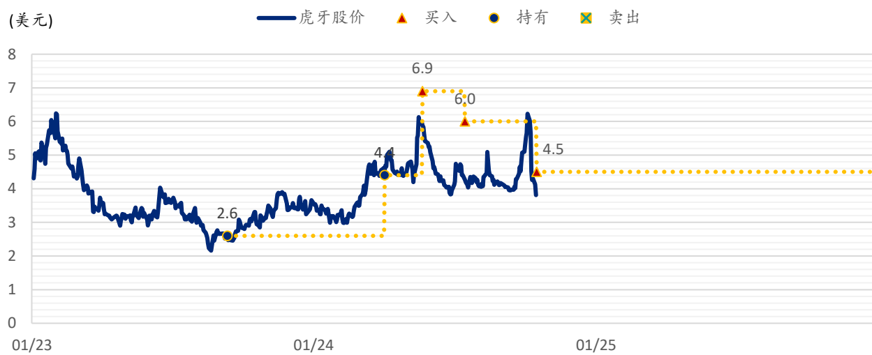
图表 2：浦银国际目标价：虎牙 (HUYA.US)