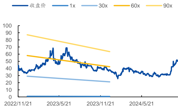
图 1：P/E Band