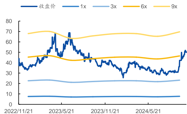
图 2：P/B Band