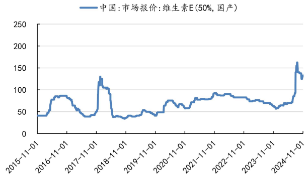
图 3: 维生素 E 价格 (元/千克)