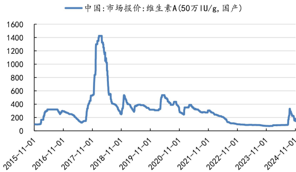
图 2: 维生素 A 价格 (元/千克)