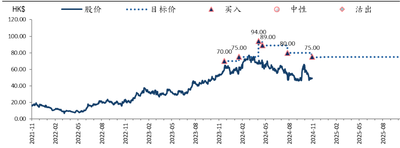
图表 2: 新东方教育科技 (9901 HK) 目标价及评级