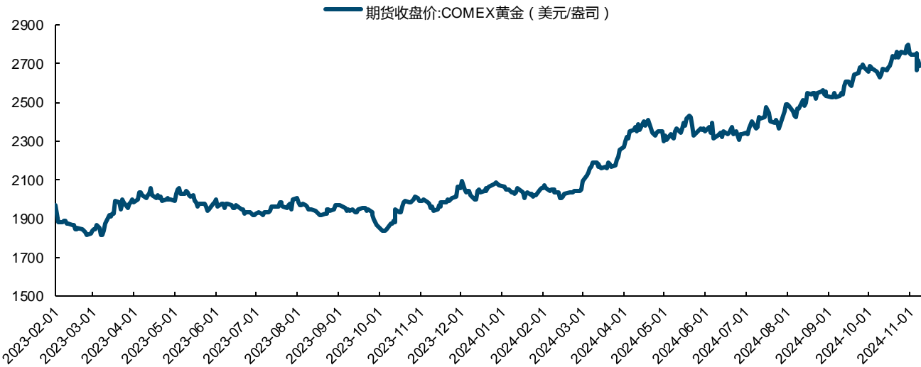
图表12: COMEX 黄金期货收盘价