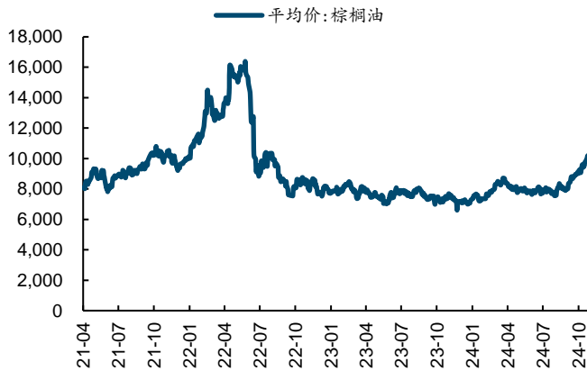
图表8：棕榈油平均价（元/吨）

COMEX 黄金期货：本周五收盘价 2691.7 美元/盎司、较 10.28 跌 2.29%。