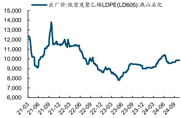
图表11: LDPE 出厂价 (元/吨)