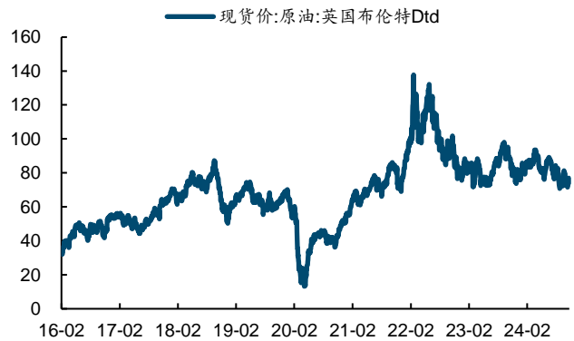
图表9：原油价格（美元/桶）