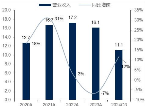
图1：公司营业收入及增速（单位：亿元、%）

2024 年前三季度，公司收入 11.08 亿元（+11.75%），归母净利润-2.08 亿元（+1.37%），扣非归母净利润-2.14 亿元（+11.99%）。单 Q3 来看，公司收入 4.48 亿元（+4.44%），归母净利润-0.16 亿元（+59.29%），扣非归母净利润-0.17 亿元（+67.16%）。在网安行业中，公司保持了相对较好的收入增速，主要系公司聚焦核心战略产品、做深做强重点行业与高价值客户的策略取得预期成果。