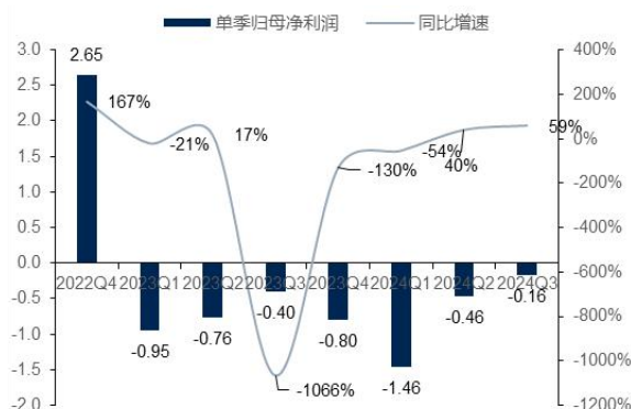
图4：公司单季归母净利润及增速（单位：亿元、%）