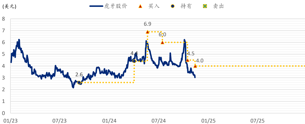
图表 2: 浦银国际目标价: 虎牙 (HUYA.US)