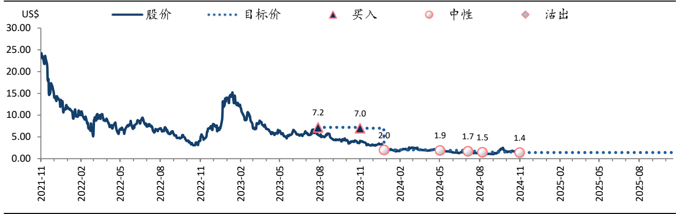
图表 3: 达达集团 (DADA US) 目标价及评级