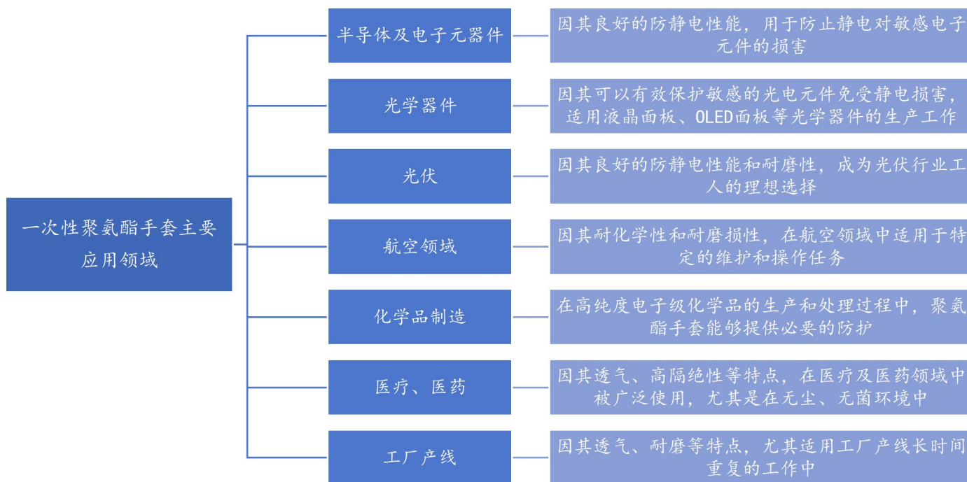
图表 3 一次性聚氨酯手套主要应用领域

此外，一次性聚氨酯手套透气不闷手，长时间穿戴不伤皮肤，更加适合医院等长时间使用场景，对丁腈手套替代作用明显。同时无毒、无污染、安全可靠等特性更符合欧洲客户采购时的绿色和 ESG 理念，未来有望改变一次性手套行业格局。