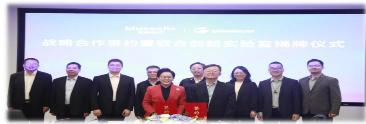
图表 1 战略合作签约现场

此次合作双方共同推进聚氨酯材料在医疗手套领域新的可能，并在此基础上逐步扩大和深化双方合作，依托联合创新实验室，重点围绕一次性聚氨酯手套、医用导管、PEBA、尼龙、PC 等医疗器械领域深化合作。同时本次合作为排他性合作，有利于降低竞争风险，体现出双方对产品充足信心。