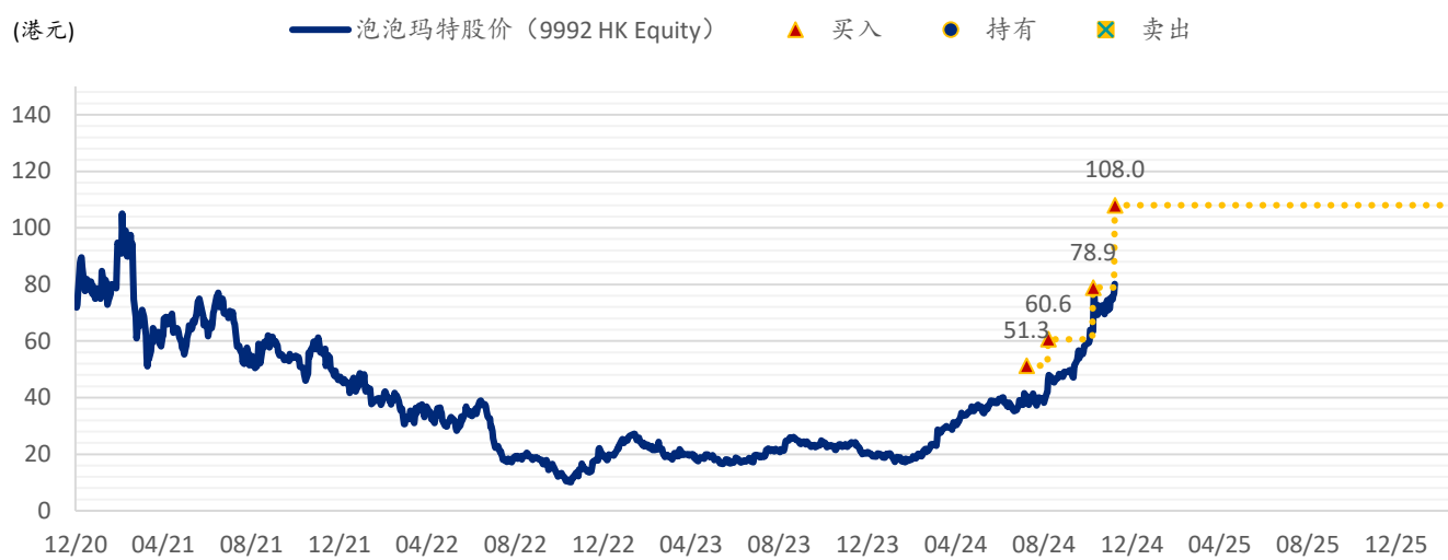
图表 2: SPDBI 目标价: 泡泡玛特 (9992.HK)