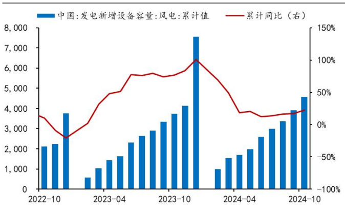
图 3：全国风电累计新增装机 (万千瓦)