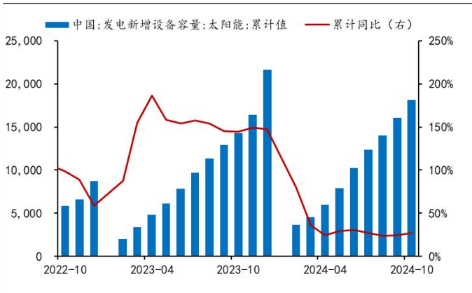
图 1：全国光伏累计新增装机 (万千瓦)

数据来源：Wind，华龙证券研究所；未评级企业盈利预测来自 Wind 一致预期。