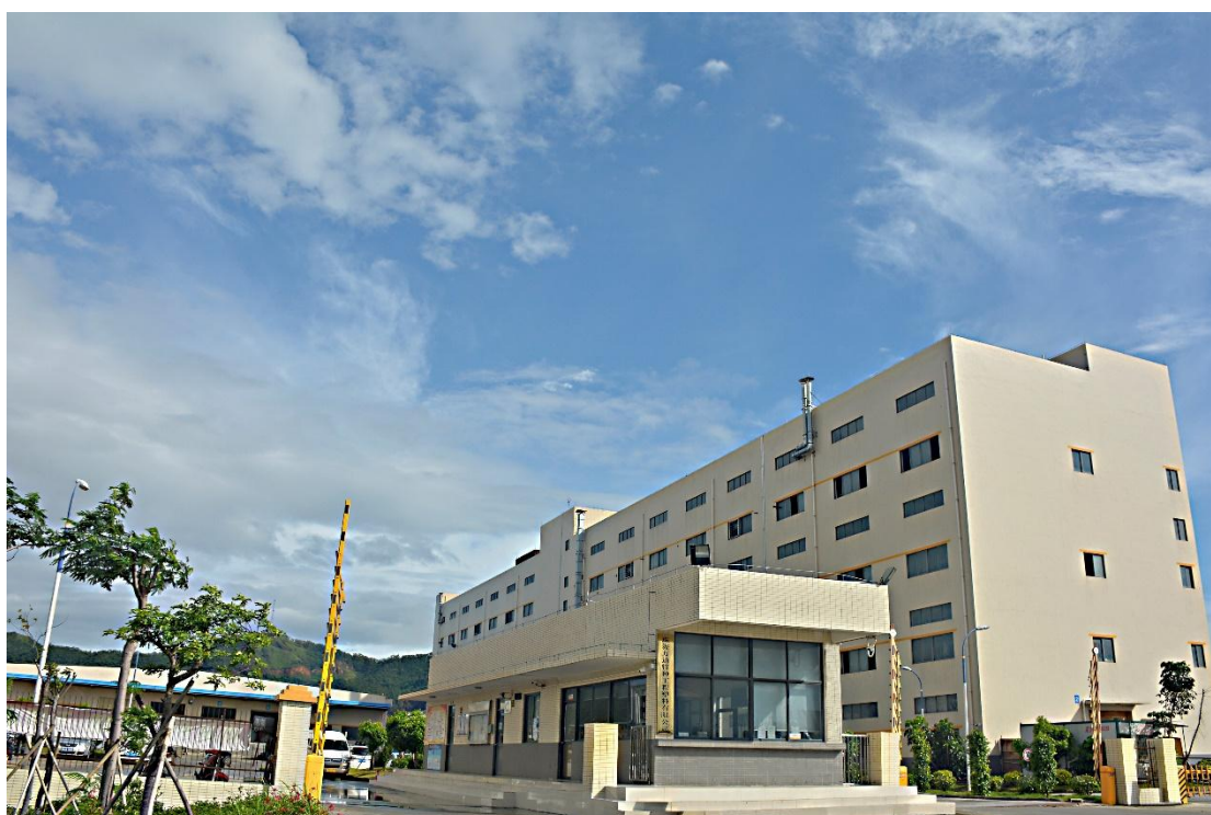
(珠海合成工厂)

据披露, 公司已通过投资 4.1 亿元, 为特塑公司在珠海建成了一个占地约 800 亩的合成工厂, 产品包括高温尼龙、LCP、聚醚砜及降解塑料等, 年产能达两万吨。