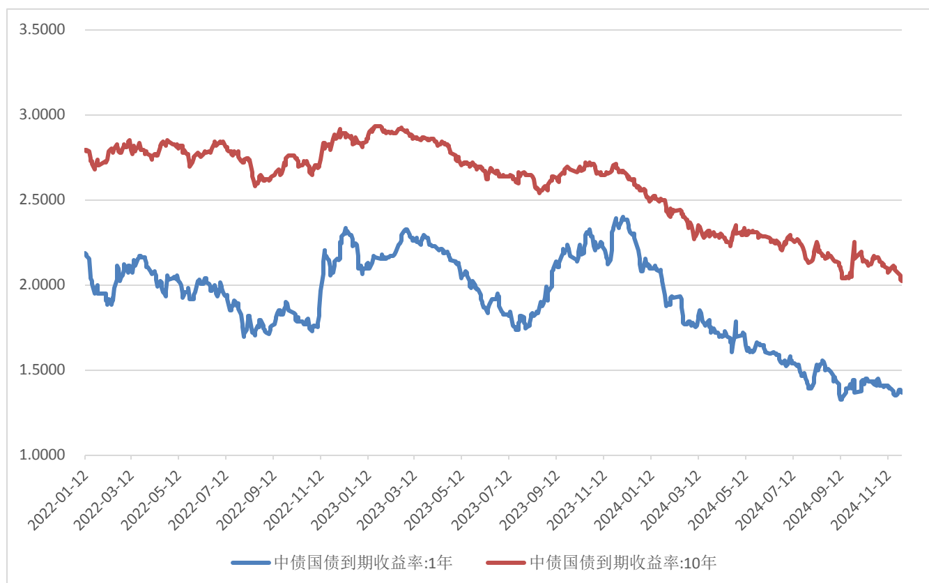
图 2：10 年期、1 年期国债收益率近 3 年数据 (%)

上周，中债 10 年期国债收益率报收 2.0206%，较前一周下行 6.26BP，中债 1 年期国债收益率报收 1.3698%、较前一周上行 1.94BP。