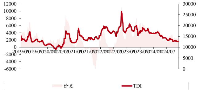
图表 5. TDI 价差 (单位: 元/吨)