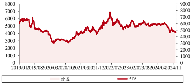
图表 6. PTA 价差 (单位: 元/吨)