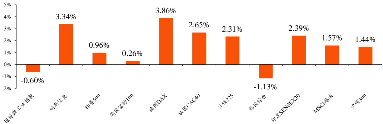
图1:本周全球主要市场大盘指数涨跌幅

本周，全球市场主要指数涨跌幅为：道琼斯工业指数(-0.6%)、纳斯达克(3.34%)、标普500(0.96%)、英国富时100(0.26%)、德国DAX(3.86%)、法国CAC40(2.65%)、日经225(2.31%)、韩国综合(-1.13%)、印度SENSEX30(2.39%)、MSCI越南(1.57%)、沪深300(1.44%)。