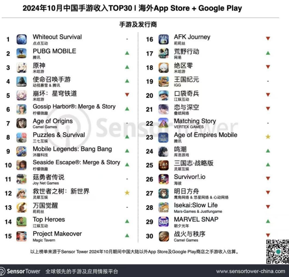
图3：2024 年 10 月中国手游收入 TOP30 | 海外 AppStore+Google Play

根据 SensorTower 数据，2024 年 10 月中国手游收入前三名分别为点点互动《Whiteout Survival》、腾讯《PUBG MOBILE》和米哈游《原神》。