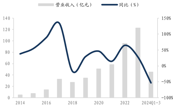
图1：2024Q1-3 营业收入 45.44 亿元，同比-53.35%