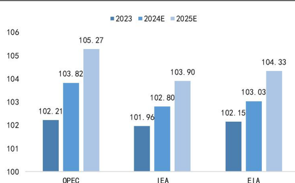
图3：主流机构对于原油需求的预测（百万桶/天）