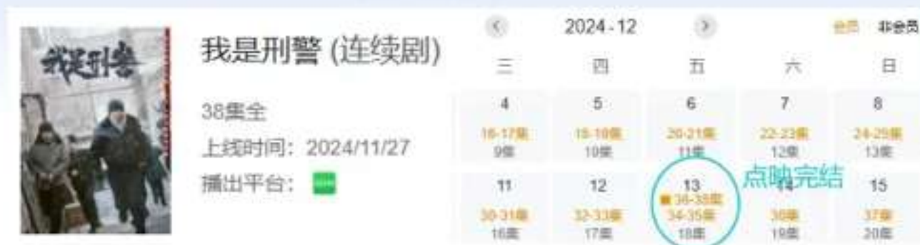
《我是刑警》更新节奏

超点权益： 权益礼包直通结局模式，包括腾讯视频“点映礼”、优酷“收官礼”、爱奇艺“加更礼”、芒果TV“观剧礼”等，用户可通过权益礼包解锁大结局观看券、花絮特辑、番外集、幕后纪录片、限定周边等多种权益组合。