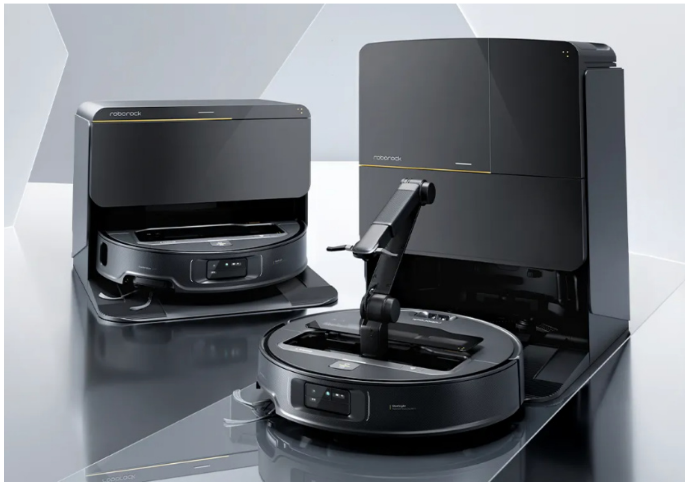
图表 1: 石头科技推出了扫地机器人新产品, 最明显的变化是采用了可折叠机械臂 石头科技G30 Space