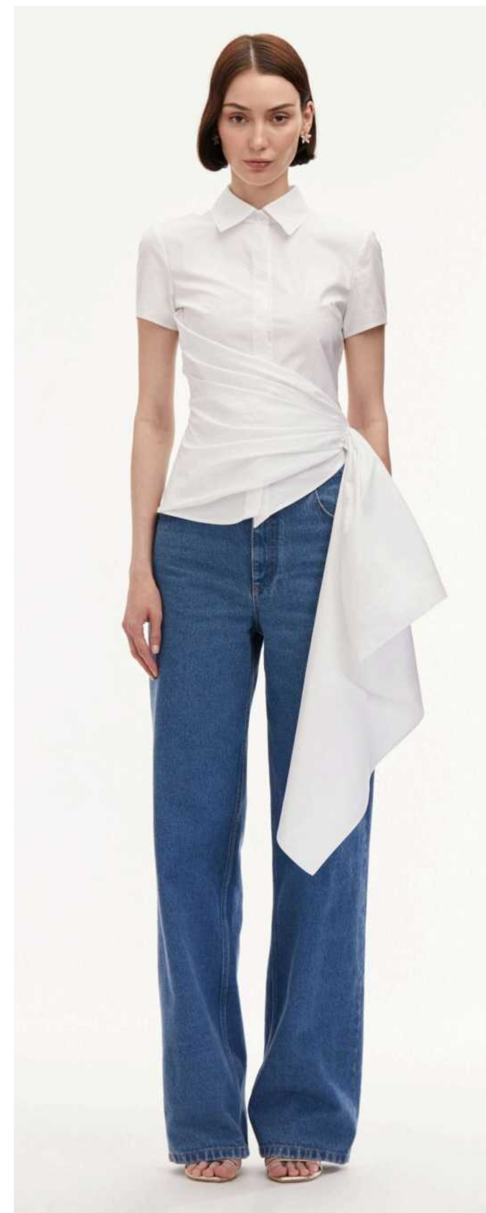
Oscar De La Renta