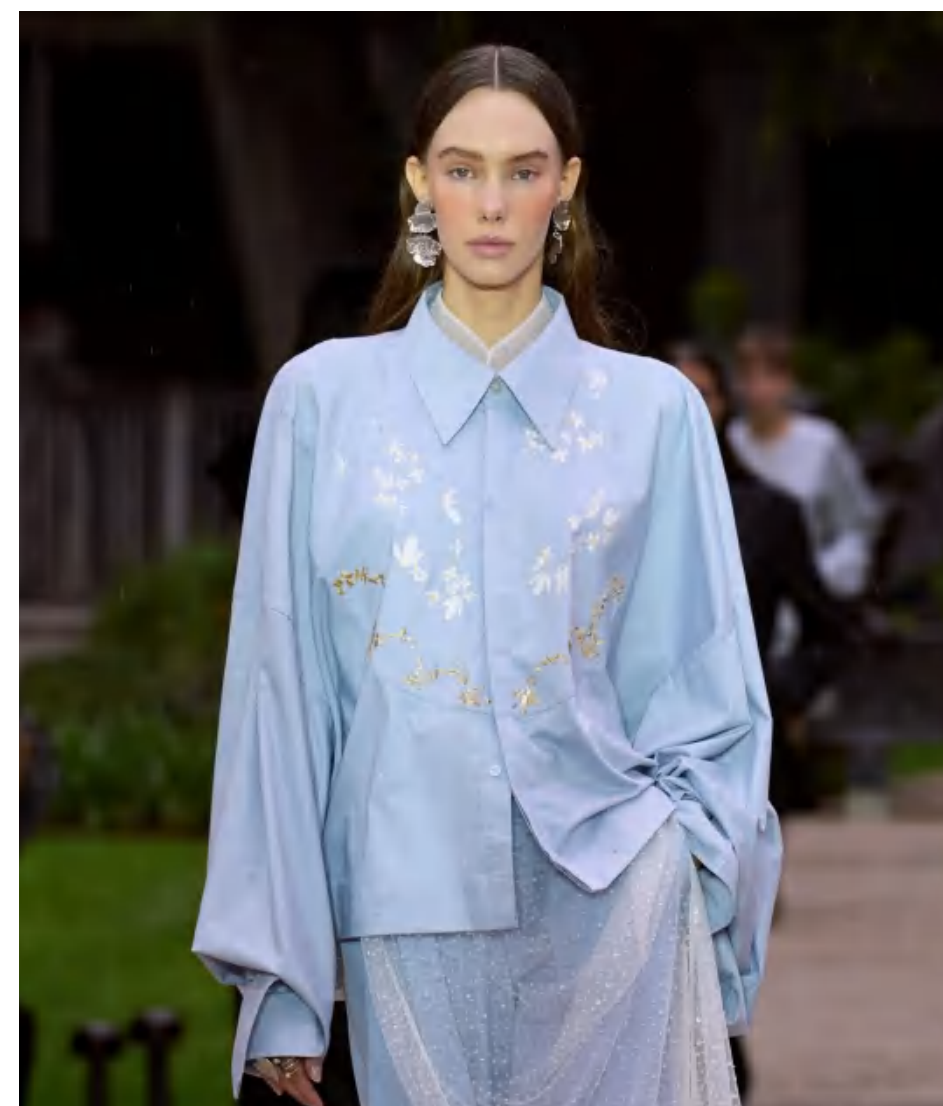
Cinq à Sept