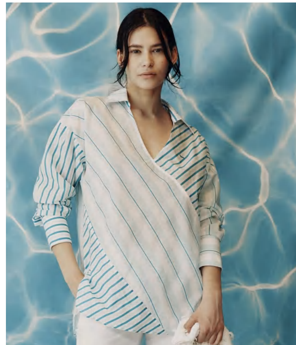
Harmont & Blaine