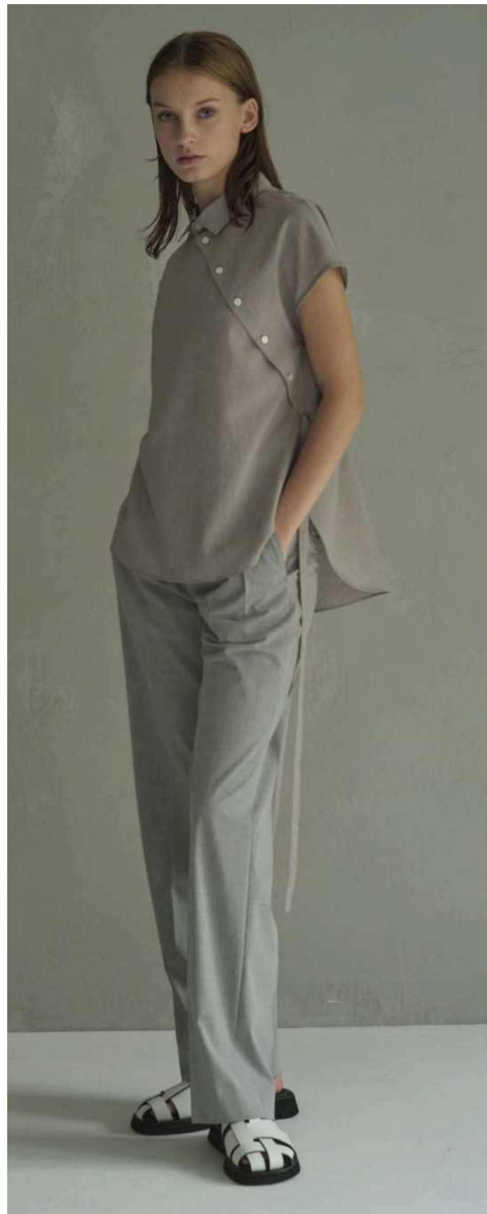
IJIT & Co.