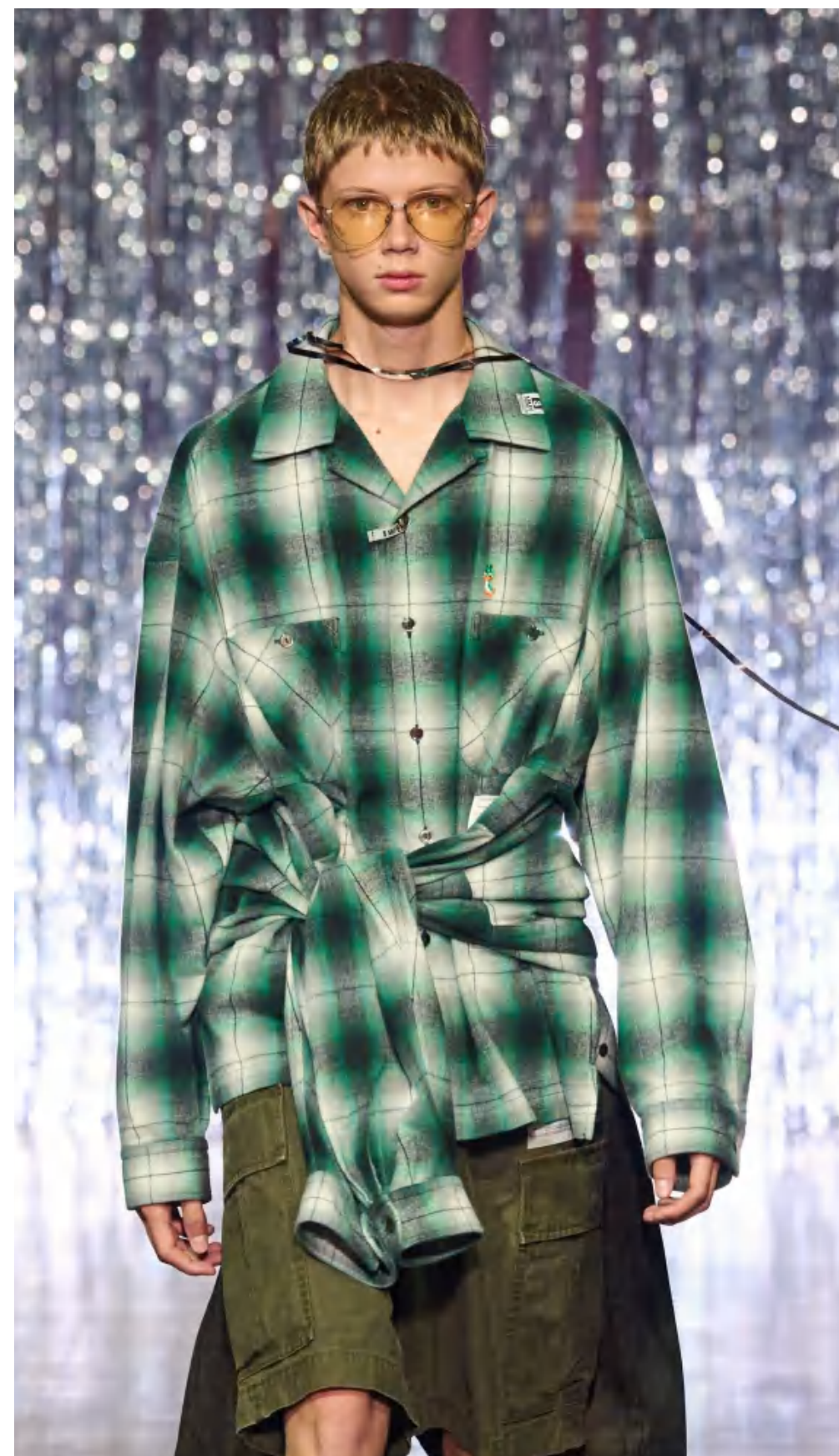
Maison Mihara Yasuhiro