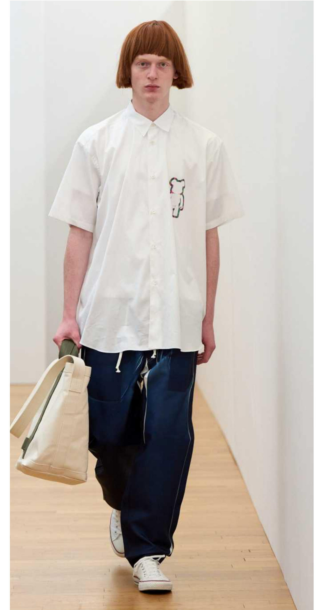
Comme Des Garçons Shirt