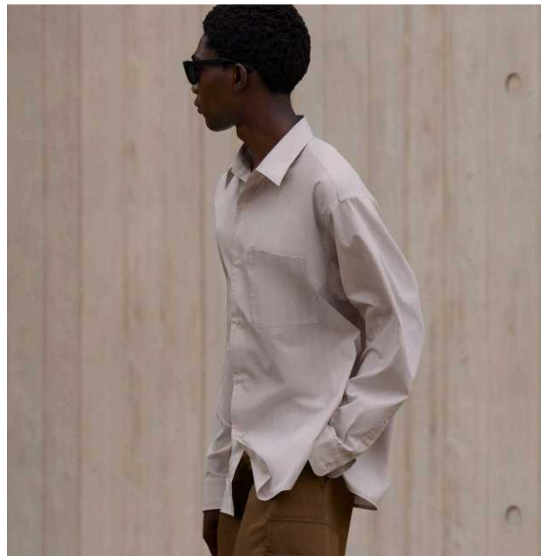
UNIQLO _ C