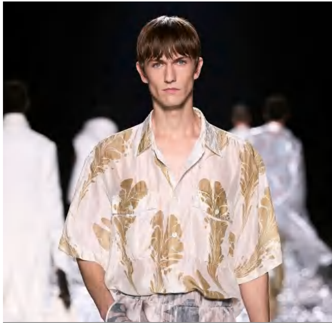
Dries Van Noten