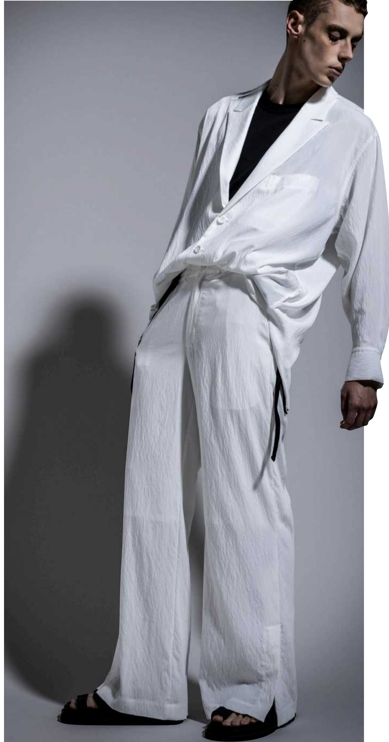
Robes & Confections