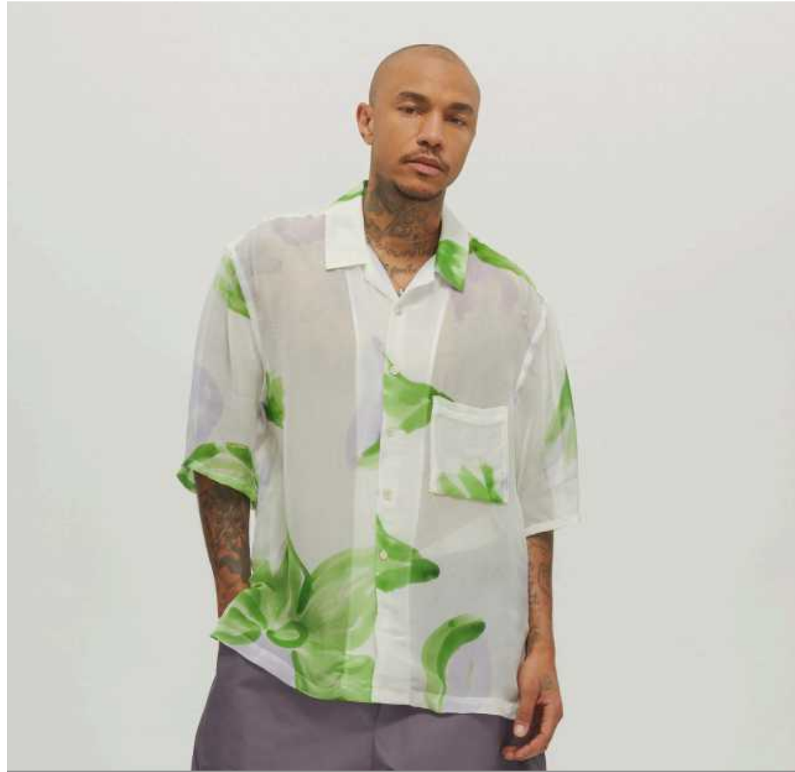
S.K. Manor Hill