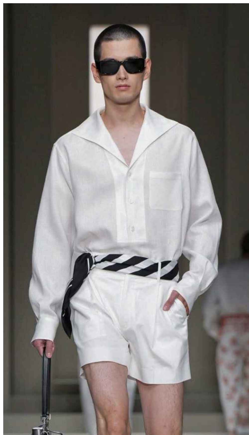
Dolce &amp; Gabbana