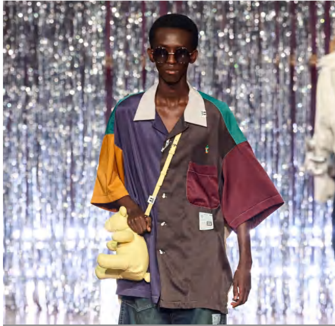
Maison Mihara Yasuhiro