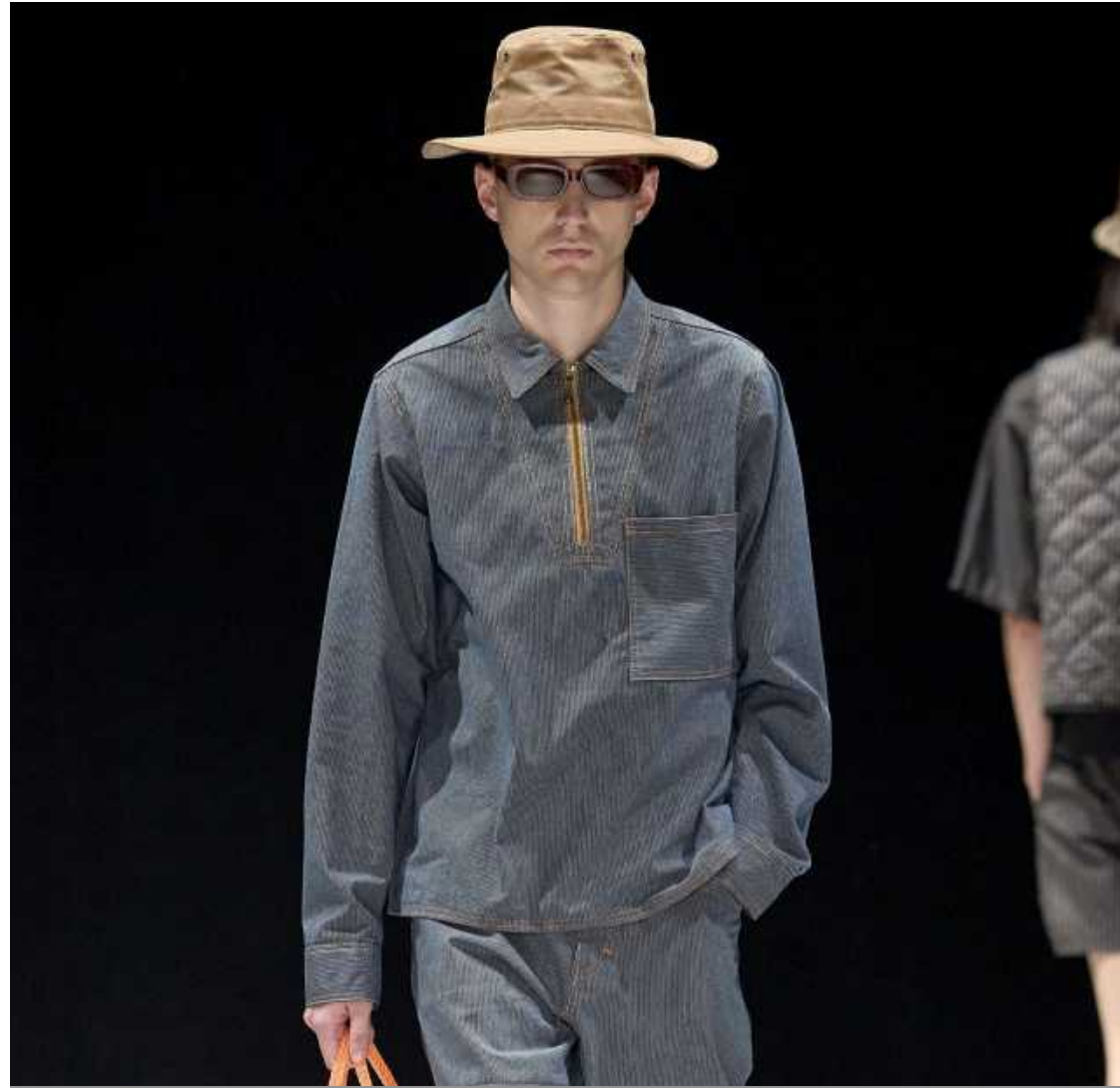
Global Fashion Collective