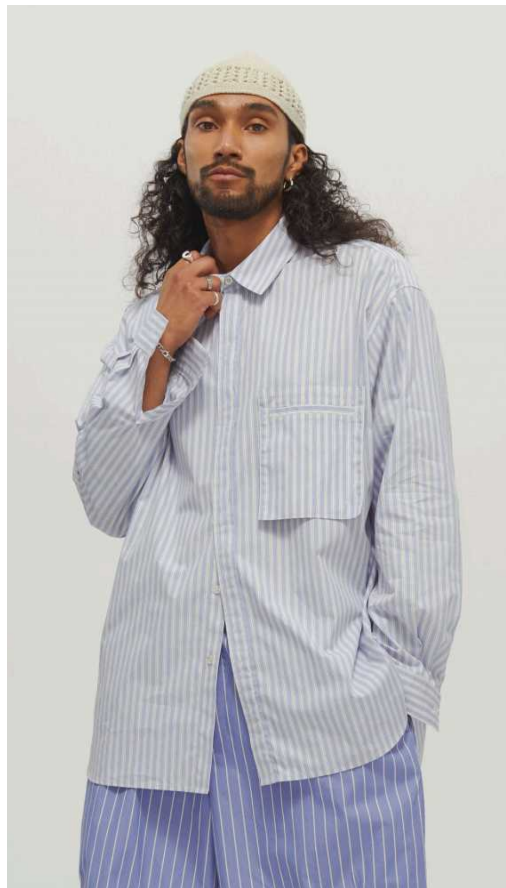
S.K. Manor Hil

对于大部分的休闲男士来说，大号宽松的款式更加的日常，款式也更加的舒服。春季气候比较暖和，所以衬衫做内搭，简单搭配一些T恤，制造叠搭模式，既不会显得单调也会非常好穿。是春夏季追求时髦穿搭人群的首选单品。