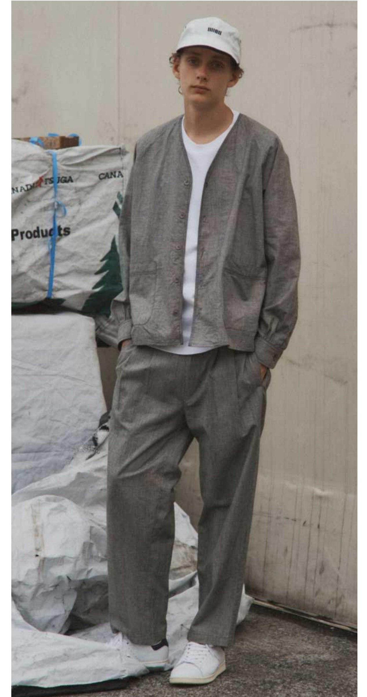
ILL ONE EIGHTY