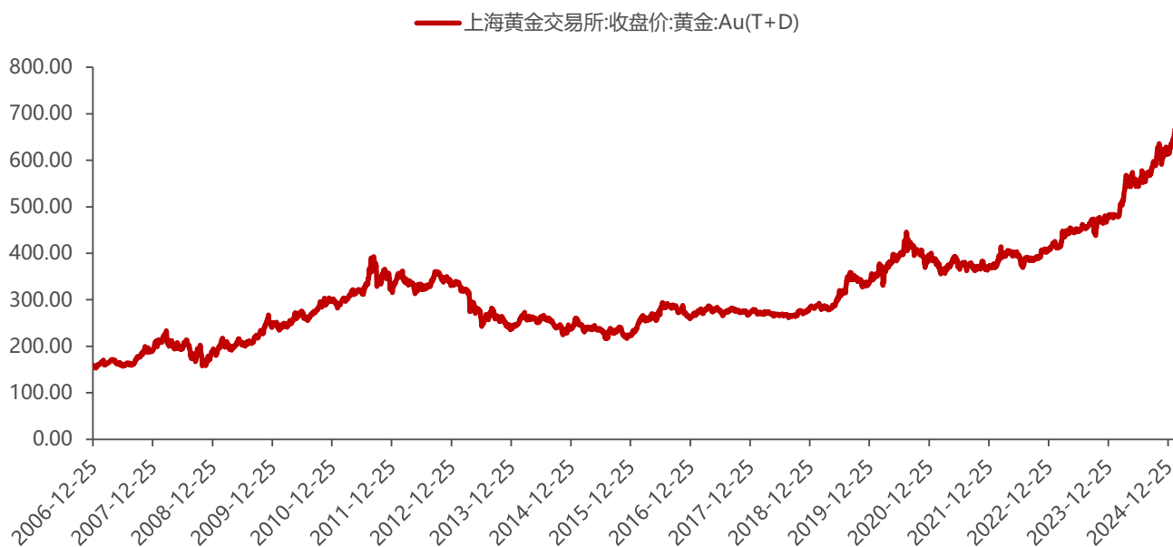
图3：上海黄金交易所黄金价格当前处于高位（单位：元/克）