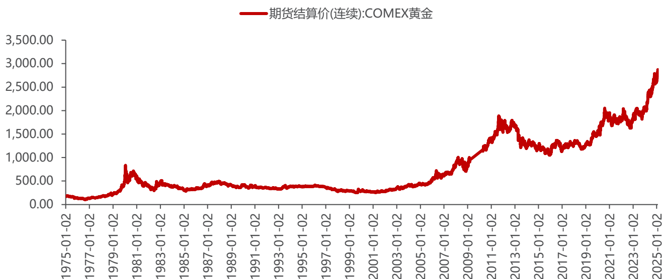
图4: COMEX 黄金期货结算价处于历史高位 (单位: 美元/金衡盎司)