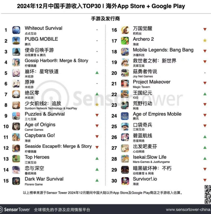
图3: 2024年12月中国手游收入 TOP30 | 海外 AppStore+Google Play