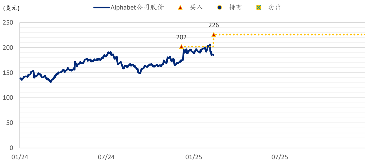
图表 2: 浦银国际目标价: Alphabet (GOOGL.US)