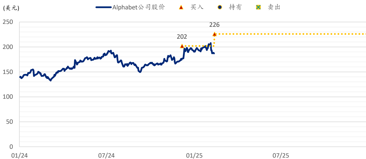
图表 3: 浦银国际目标价: Alphabet (GOOG.US)