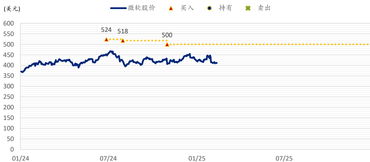
图表 2：浦银国际目标价：微软（MSFT.US）