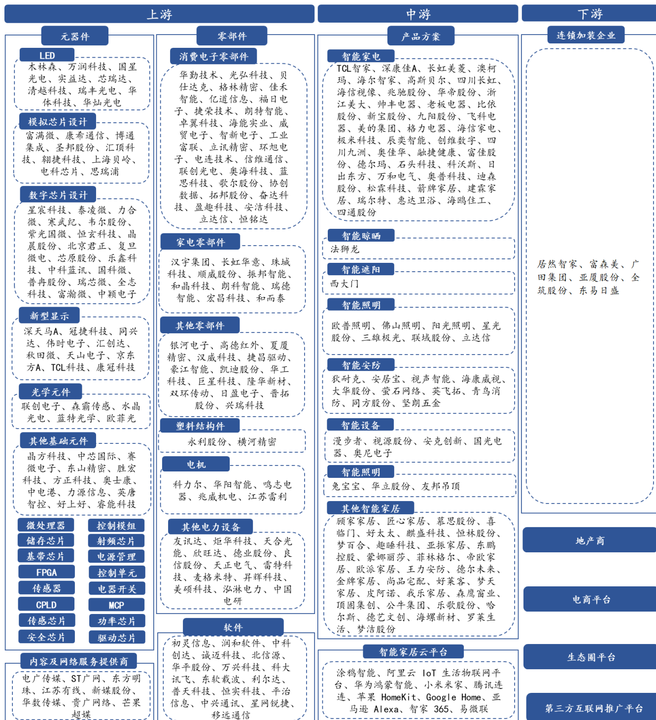
图 3：智能家居产业链及相关标的