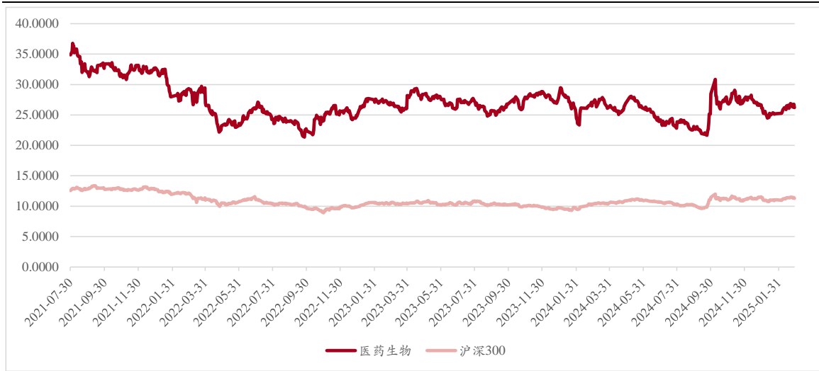
图表 3. 申万医药生物近年 PE（TTM）表现（剔除负值）（倍）

截至 2025 年 2 月 28 日，申万医药生物板块市盈率（TTM）为 26.19 倍，估值相较于 2024 年 7-8 月估值低谷有所回升，但是仍然低于 2021 年估值水平。