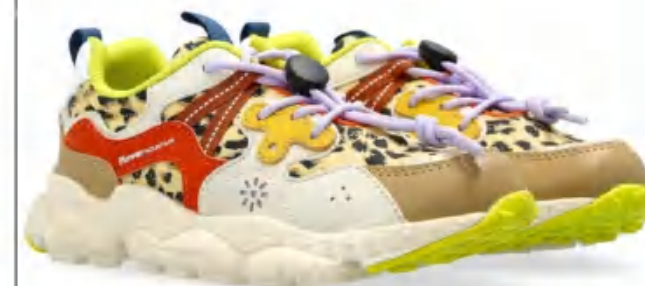
FLOWER MOUNTAIN KIDS