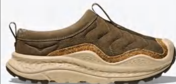
Hoka One One