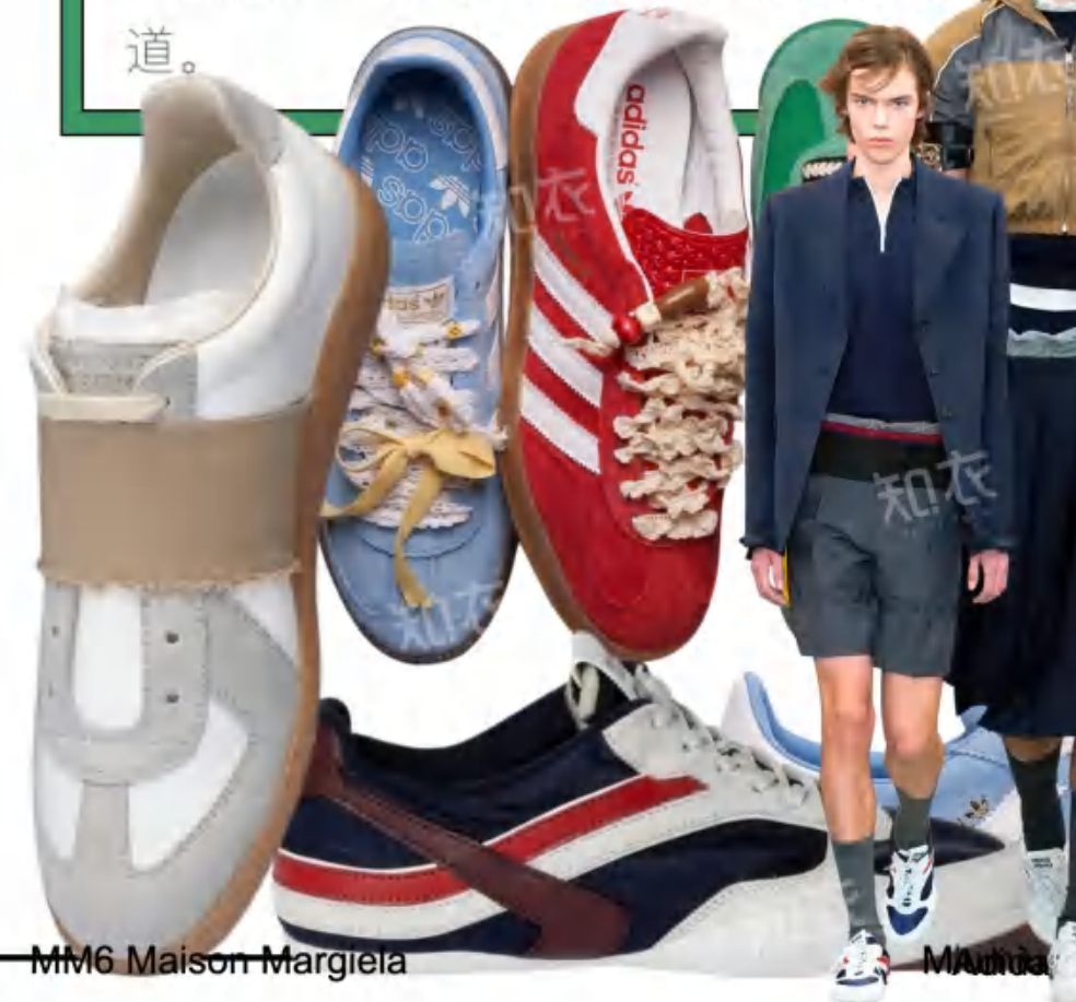
MM6 Maison Margiela