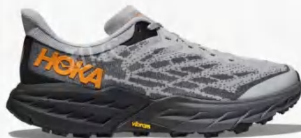
Hoka One One