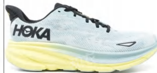
Hoka One One