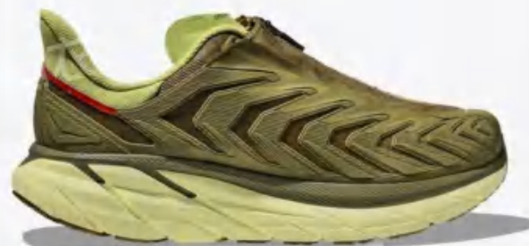
Hoka One One