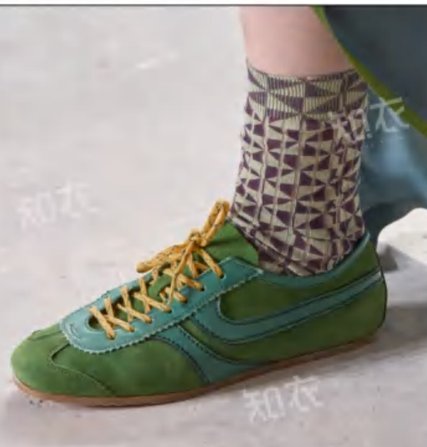
Dries Van Noten