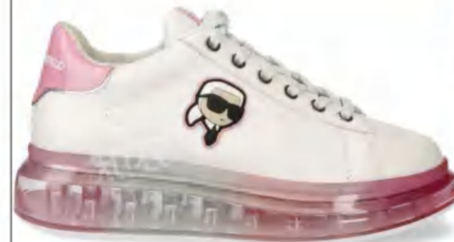
Karl Lagerfeld 卡尔拉格斐