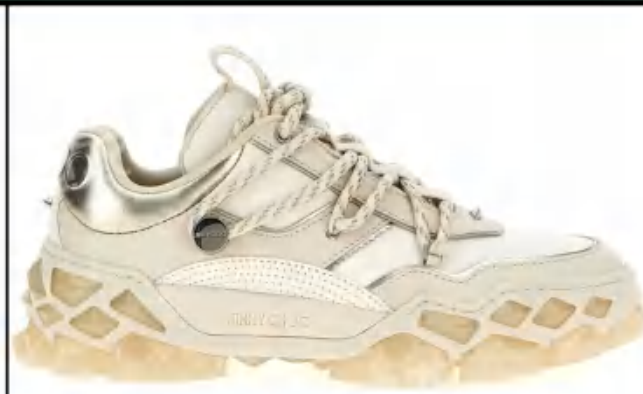
Jimmy Choo 吉米·周