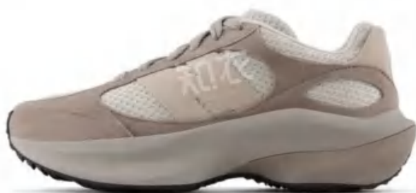
NEW BALANCE 新百伦