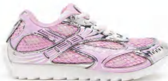
Bottega Veneta 葆蝶家