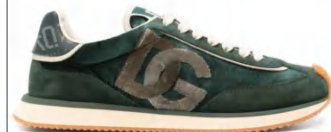
Dolce & Gabbana