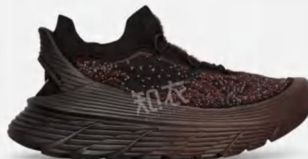
Hoka One One