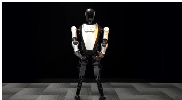
图3: 乐聚机器人最新视频 1

2025 年 3 月 6 日，乐聚机器人发布更新视频，通过表演“咏春”展示夸父手臂灵活性。