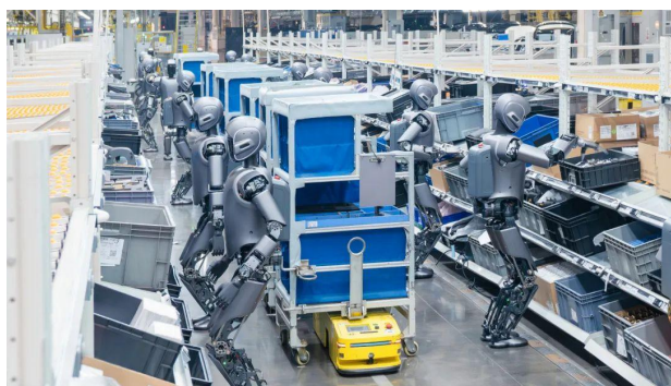
图1: 优必选最新视频 1

2025 年 3 月 3 日，优必选在极氪 5G 智慧工厂开展全球首例多台、多场景、多任务的人形机器人协同实训，探索建立面向多任务工业场景的通用人形机器人群体作业解决方案，推动人形机器人从单机自主向群体智能进化。优必选创新提出了人形机器人脑网络（BrainNet）软件架构，并设计人形智能网联中枢 Internet of Humanoids (IoH)，为群体智能的软硬件实现提供了可借鉴的路径。