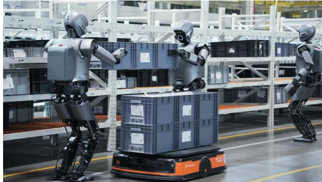
图2: 优必选最新视频 2