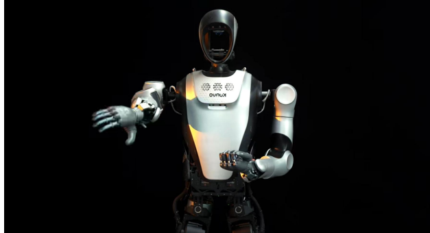
图4: 乐聚机器人最新视频 2