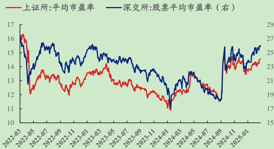
图 1：最近三年沪深两市平均市盈率变化（单位：倍）