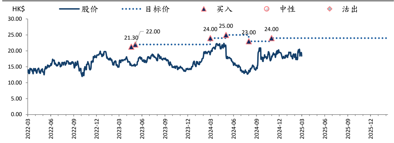
图表 3: 同程 (780 HK) 目标价及评级